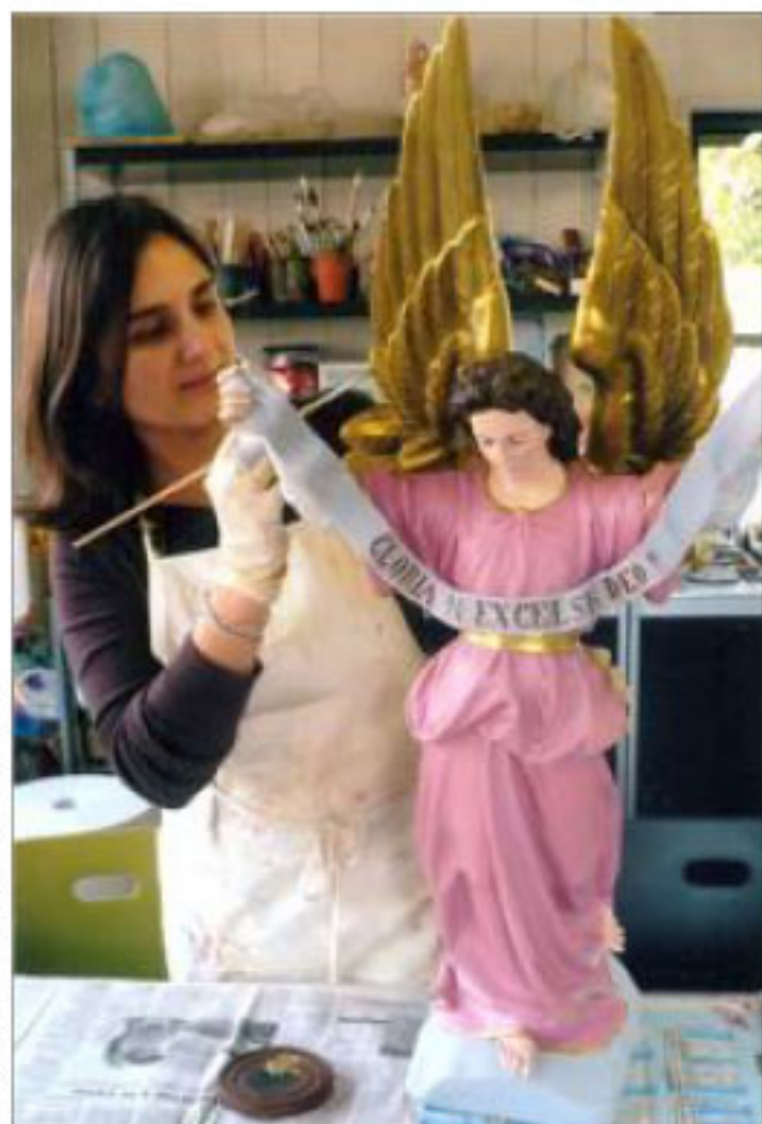
La restauration des œuvres d'art en général et des statues d'église en particulier fait partie du champ des compétences de l'artiste.

un public plus large ». C'est chose faite aujourd'hui puisque des adultes ont rejoint le mouvement. Si bien que les séances des mercredis et vendredis sont complètes. Et impossible de pousser les murs pour accueillir plus de monde : « Cet atelier appartient à ma belle-famille, on n'y touche pas ! » rigole-t-elle.