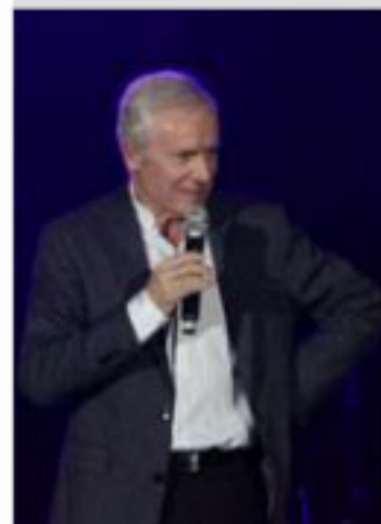
L'humoriste Pierre Douglas.